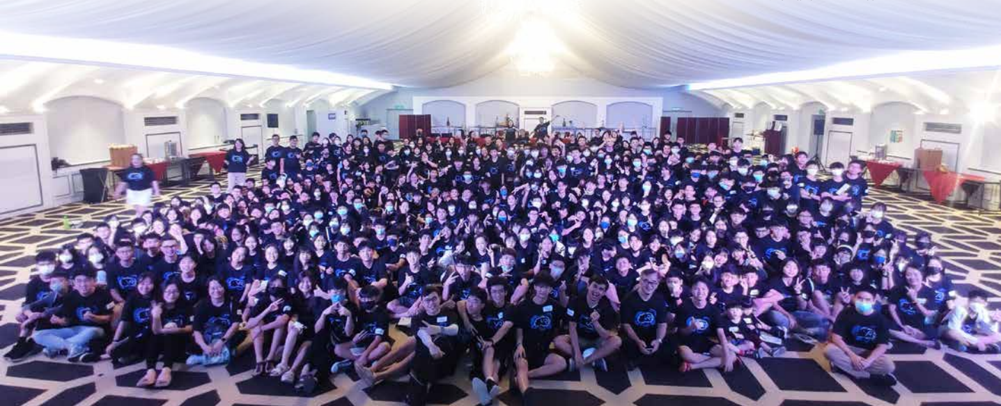
热闹非常的室内全体照。