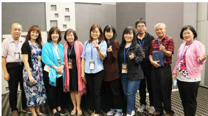
我们相聚是为了分散，到各地建立主的教会。