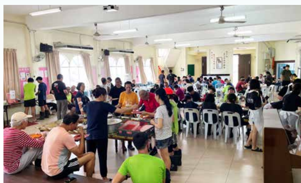
长老会永平堂成为赈灾基地，同时成立支援团队，预备餐食给义工和灾黎。

水灾考验教会的爱心，感恩教会都积极参与赈灾，成为光和盐，落实社区关怀。同时，众教会也体现主内一家的情怀，彼此扶持鼓励，送上温暖。有爱，再难的日子也能走过去，因为有教会与我们手牵手一起走！感谢神，这爱从神来！