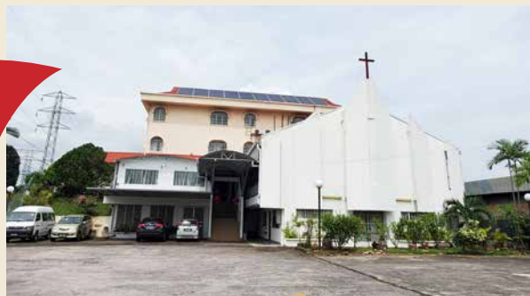
巴生长老会 1963年新马长老大会设立