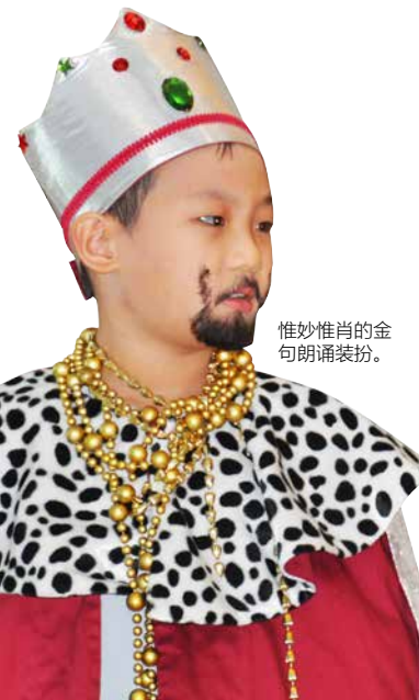
惟妙惟肖的金句朗诵装扮。

二〇二二年十二月十六日（周五） 上午九时四十五分至下午二时， 全国长老宗十五间教会， 共106位主日学生参与 在居銮佳音堂进行的 儿童圣经比赛。