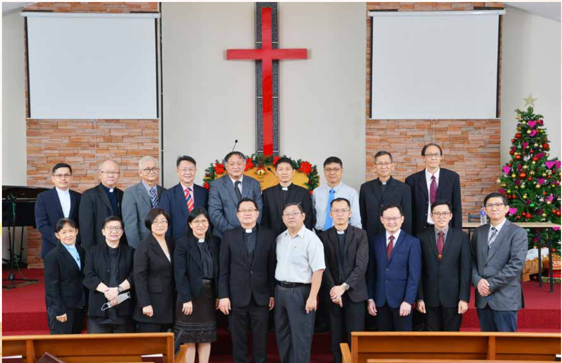
新出炉的西部区会第二十七任常委。

西部区会年议会的结束，也是西部区会五十周年庆的开始，历史不断在翻页，至此，西部区会也进入了另一令人期待的时刻。