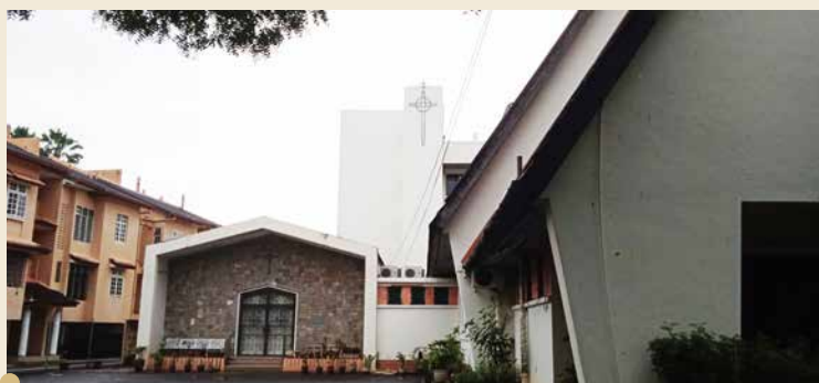
槟城圣安德烈堂 1851年伦敦长老会创立