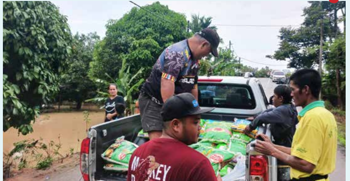
昔加末长老会物资支援Bukit Serok原住民村。

由于水灾严重，南部区会社关组随即在三月三日领导赈灾行动，募捐赈灾基金。截至三月六日上午，在各教会积极参与下，赈灾认献已达RM118,500。