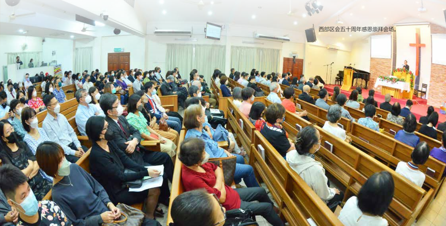
西部区会五十周年感恩崇拜会场。