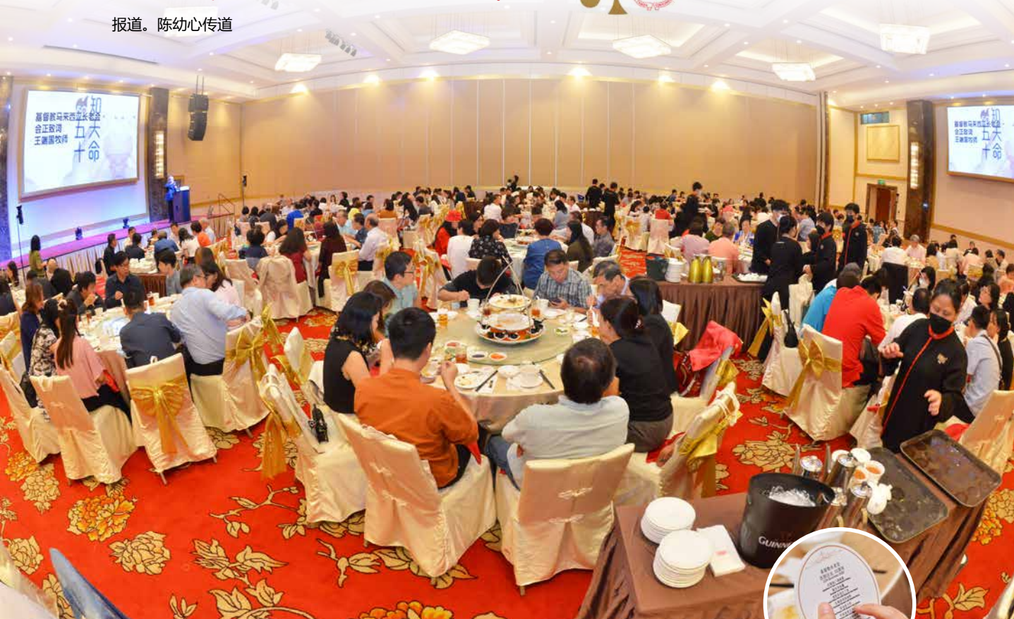
礼堂中坐满喜乐的人们，充满欢聚的温馨。