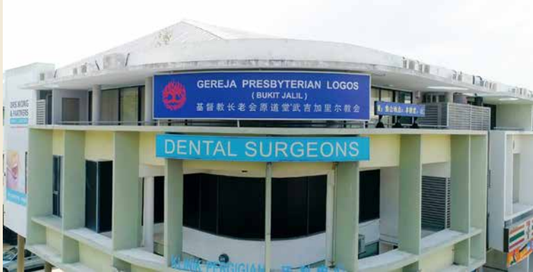
武吉加里尔教会 (2017年)