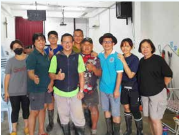
三月六日，昔加末长老会的赈灾团队。