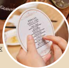
美味佳肴就如神在西部区会的恩典，何其丰富。

二〇二二年十二月十二日（一）晚上七时半，西部区会众肢体在巴生长老会参加五十周年感恩崇拜后，随即移步到巴生“好想吃酒楼”，参与西部区会五十周年感恩爱筵。