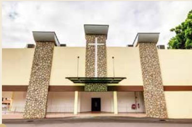
圣安德烈堂（怡保）英文堂 1989年从怡保圣安德烈堂（中文部）分出