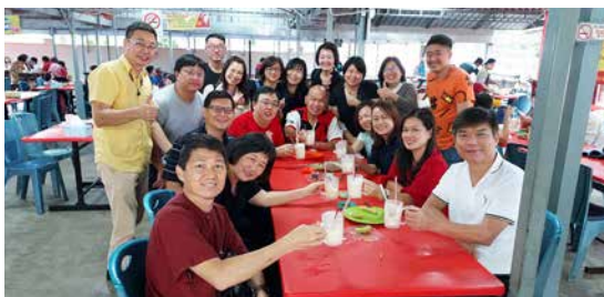
出外寻找美食与他组的“觅食者”不期而遇，好热闹。