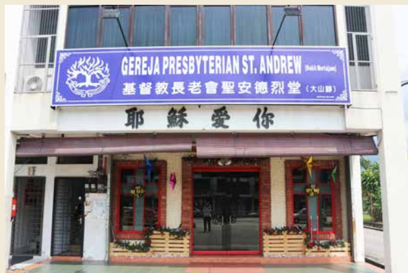
大山脚圣安德烈堂 1980年槟城圣安德烈堂植堂