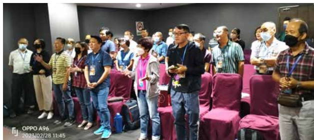
四十八人报名参加“四层查经”工作坊。