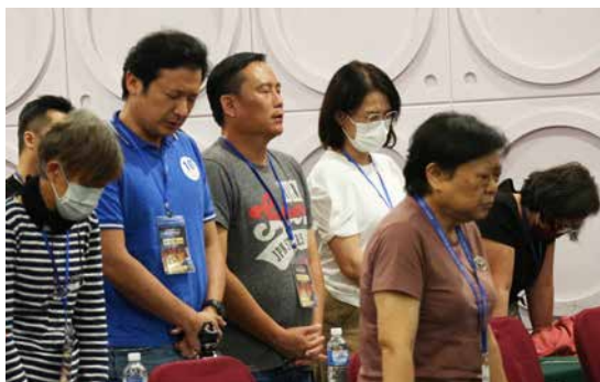
唯有跪倒主前，教会才能增长。