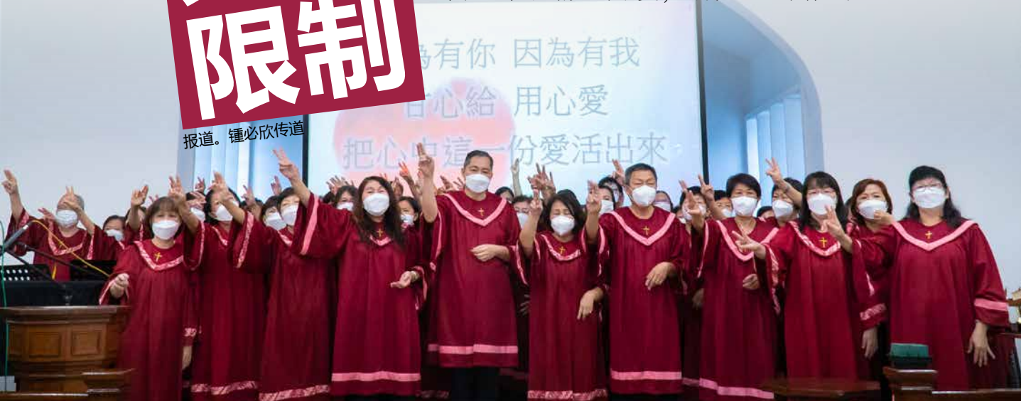
耆兵们呈献手语《活出爱》。

对新山天国耆兵的六十几位学员来说，二〇二二年十二月二日是个特别的日子，因为他们经过将近半年的不懈努力，终于迎来了甜美的果实，即第一届的结业礼。