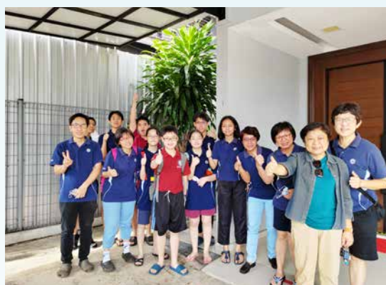
三月七日，大马堂赈灾队前往哥打丁宜进行赈灾。

此外，拉美士荣美教会、永平堂和峇株吧辖救恩堂先后成为赈灾基地，永平堂甚至组织十五至十七人的后援团队，预备午餐和晚餐给协助清洗的义工和灾黎。