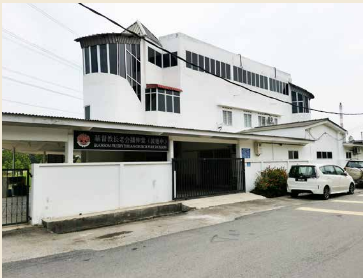
波德申播伸堂 1980年由南部区会移到西部区会