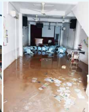
水灾后，三合港荣美教会内部一片狼藉。