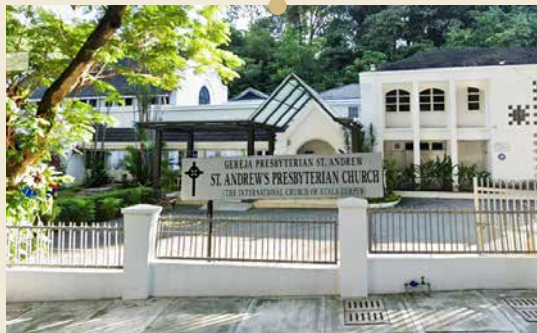
原道堂 1963年新马长老大会设立