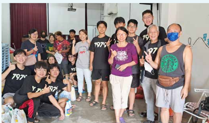
三月七日，新港及永平长老会的赈灾年青新生代。