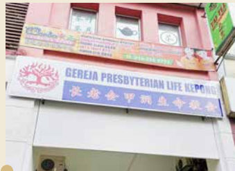
长老会甲洞生命教会 2019年西部区会植堂