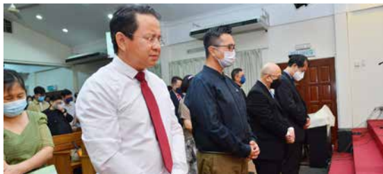
众人一同为奉献的金钱献上祷告。