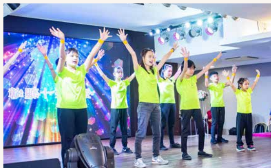
儿少呈献活泼的舞蹈。