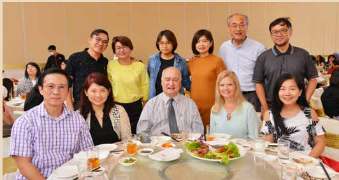
英语区会出席代表。