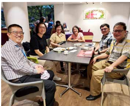
疫情之后，同工们更珍惜难得的相聚。