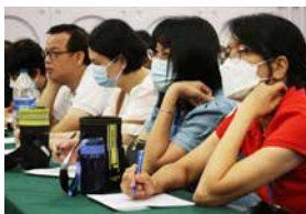
参加者认真思考，预备寻找“同路人”。