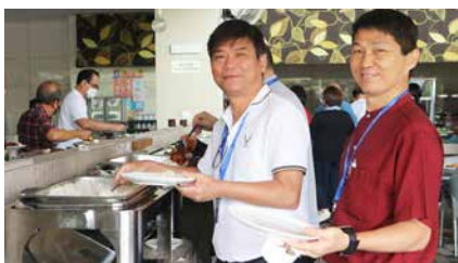
身体吃饱饱，心灵喂饱饱。