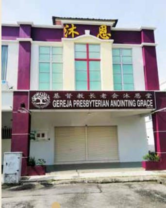
沐恩堂 1998年巴生长老会植堂