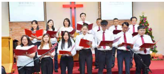
加影加恩堂诗班献诗《来做工》。