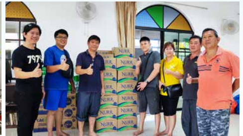
三月六日，新邦令金长老会前往三合港支援灾区。