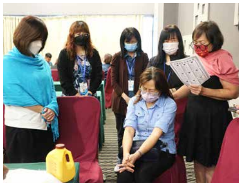
组员彼此代祷，也为组员的教会祷告。