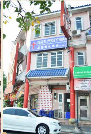
金宝长老会 2009年西部区会植堂