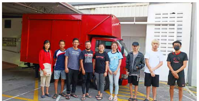
三月六日，峇株救恩堂慈善部派一队救援队前往灾区清理。