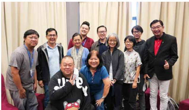
来自不同教会的组员拍照留念。