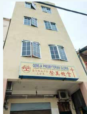
三合港荣美教会水淹一尺。

三月一日，官方通报柔佛的受灾县属增加至七县，包括新山、哥打丁宜、居銮、峇株巴辖、麻坡、东甲和昔加末。当中，昔加末、拉美士、三合港、居銮市区成为重灾区，教会建筑受水灾波及的长老会是三合港荣美教会（水淹一尺）及哥打丁宜真道堂（底层浸水）。