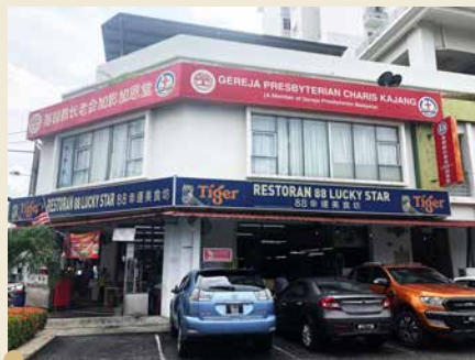
加影加恩堂 2014年西部区会植堂