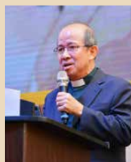
长老大会会正王端国牧师致词。