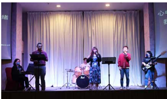
闭幕礼上，敬拜组以诗歌《门徒使命》带领众人回应神的呼召。