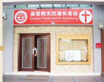
无拉港长老会 2002年西部区会植堂