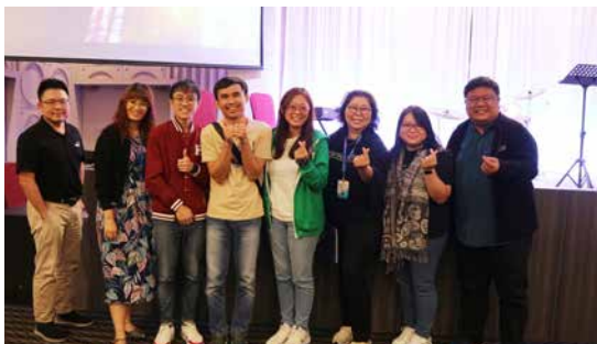
以诗歌服事的敬拜团队。