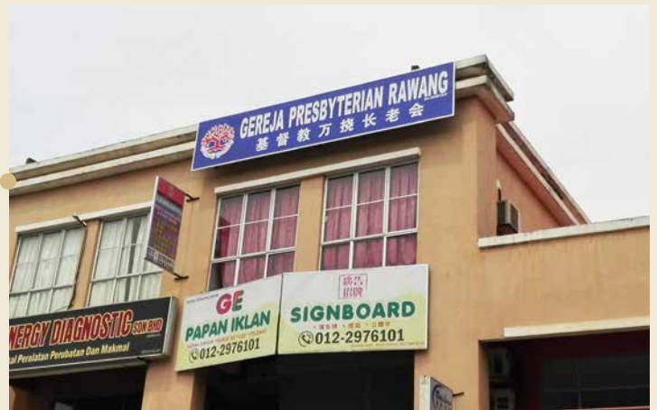
万挠长老会 2011年加入西部区会