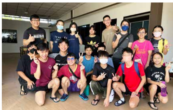
三月六日，永平堂的赈灾团队。