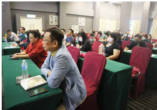
六十人报名参加“家庭事工”工作坊。