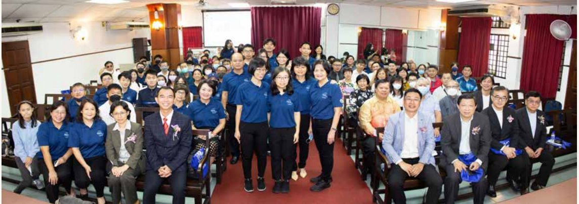
七十周年感恩崇拜全体照。

散会后，我们移步到古来新嘉宾酒楼享用感恩午宴。这次的午宴主要目的是为了感恩，其次也为了筹募建堂基金。区内外各教会、本堂会友、神学院及其他企业也热心购买午宴餐券。由于距离目标尚远，大家也上下一心，自由奉献。如大卫所作的祷告“耶和华我们的祖先以色列的神，是应当称颂的，从亘古直到永远……耶和华我们的神啊，我们预备的这一切财物，要为你的圣名建造殿宇，都是从你而来的，也都是属于你的”（代上二十九10-19）。