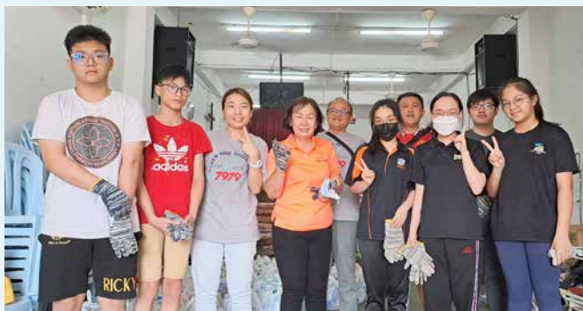
三月七日，关丹荣恩堂的赈灾团队。