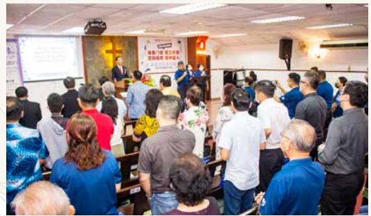
周年感恩崇拜会场。