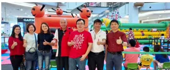
卸下忙碌的服事，教牧领袖难得一起到购物中心逛逛。

各别参加工作坊后，二月二十八日下午是大家难得出外jalan-jalan的时间，参加者有的约会教会领袖同工；有的约同难得见面的好友；有的与刚认识的同路人结伴同行。大家结伙出外吃喝玩乐，有的一起享用美食、有的一起喝咖啡、有的一起购物，大家都以感恩的心领受神的赐福，在吃喝与享乐之间取得平衡，同时也与同路人有美好的互动交流。