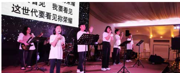
少年人带领敬拜赞美。

感谢赞美主！经过一连串的宣传，本次营会吸引了358位报名者，当中包括312位少年人（257位少年人首次参与营会）、少年导师26位。这无疑是上帝的带领与感动，使少年人热切回应并报名参与。