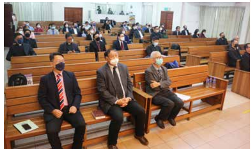
感谢巴生长老会提供宽敞的年议会会场。