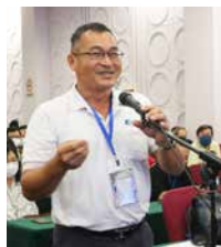
参加者向讲员提出他心中的疑惑。