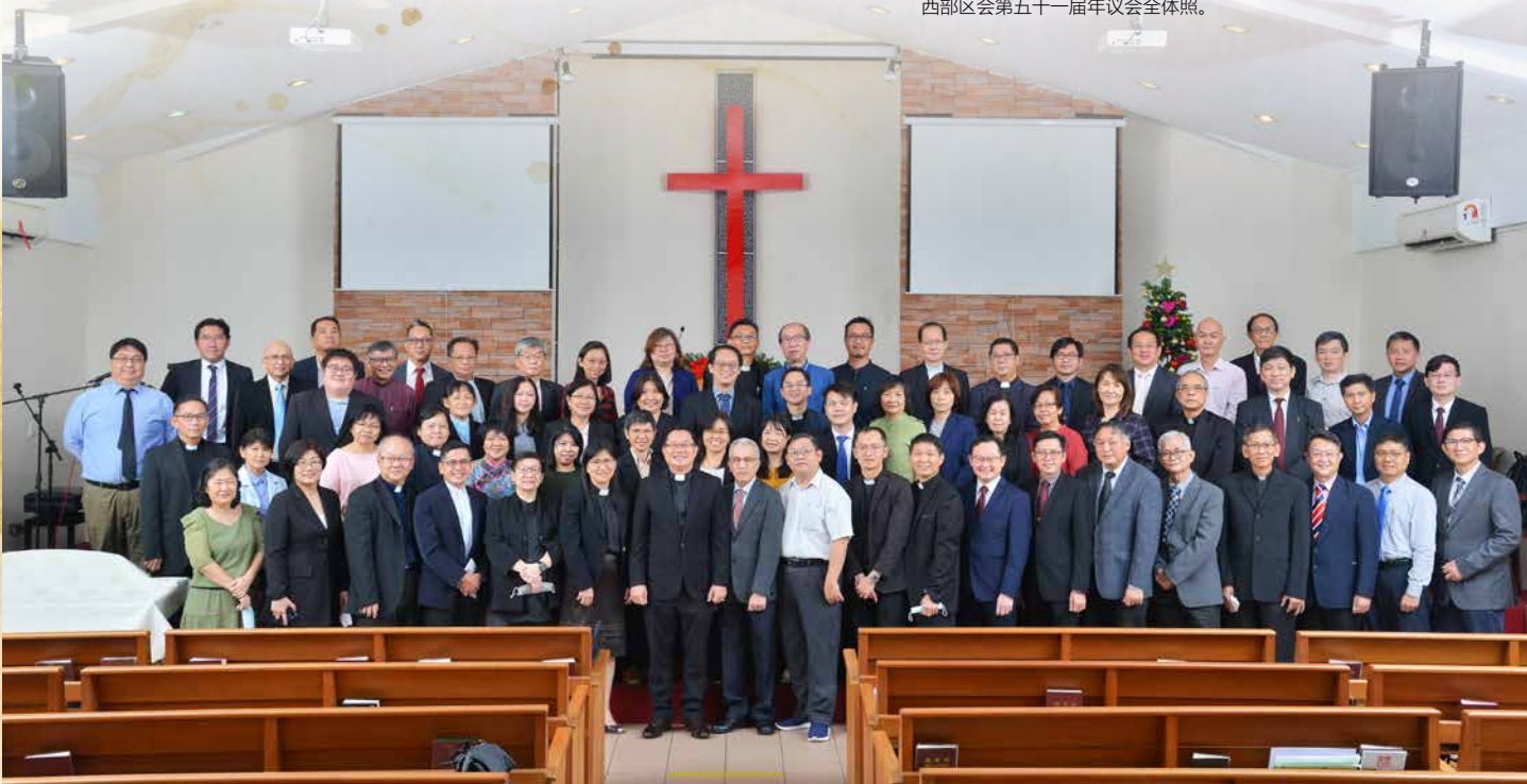
西部区会第五十一届年议会全体照。