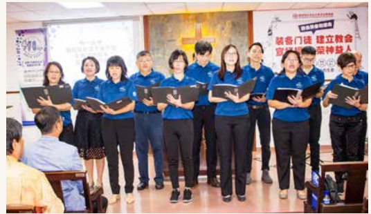
诗班献唱《有一位神》。

从古来圣安德烈堂70周年纪念暨筹募建堂基金特刊的简史可知，古来圣安德烈堂（原名：中华基督教会）于一九五二年成立。当时第二次世界大战结束不久，马来亚半岛进入紧急状态，英殖民政府命令华人拆除房屋，集中于新村。那时，西方宣教士黎节姑娘来古来设教。她与另一位同工创办了圣安德烈幼稚园，也为产妇服务。后来，幼稚园事工成长壮大，人数增加。本来修建的聚会所与传道屋也因此扩建，有更多人因为教会的幼稚园事工信主，成为会友。