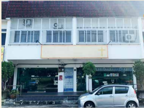
新邦波赖圣安德烈堂 1982年 怡保圣安德烈堂植堂