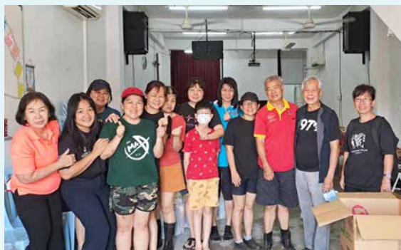
三月七日，马六甲及昔加末长老会的赈灾队伍。