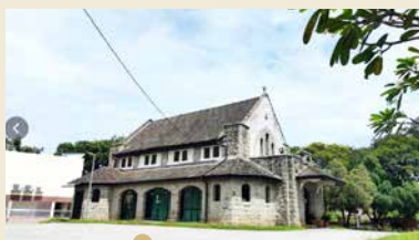
怡保圣安德烈堂 1929年苏格兰长老会创立