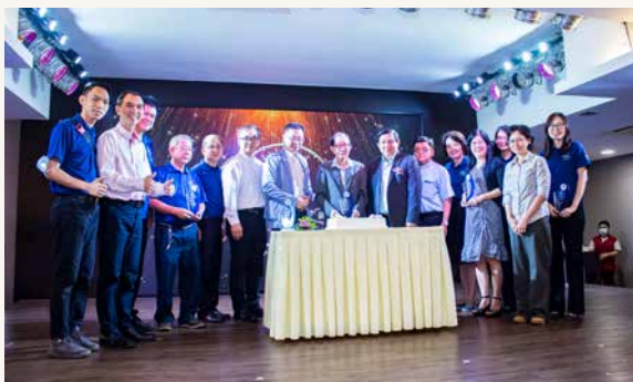
教会与区会代表共切生日蛋糕。