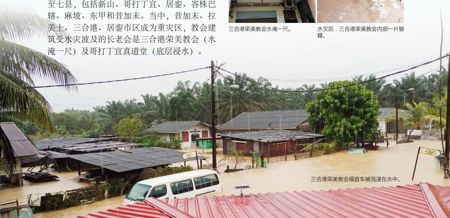
三合港荣美教会福音车被浸泡在水中。