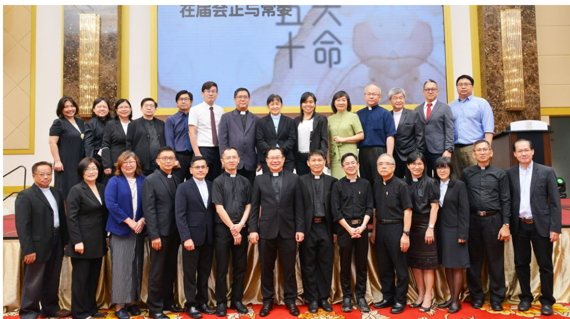
西部区会现任教牧难得大合照，他们都是建立西部区会圣工的重要工人。