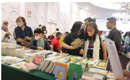
心灵要丰盛，看书不可少。

在这三堂主题信息中，讲员苏立忠牧师以言教身教的方式，带领与会者进入现代社会的场景，走入教会牧养的实况。借此，我们一方面看见时代的变迁，另一方面，我们也看见领袖培育的必须，教会与时俱进的刻不容缓。