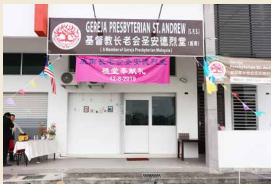
威南长老会圣安德烈堂 2019年大山脚圣安德烈堂植堂