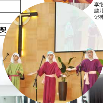
金句朗诵是本届比赛的一大亮点。