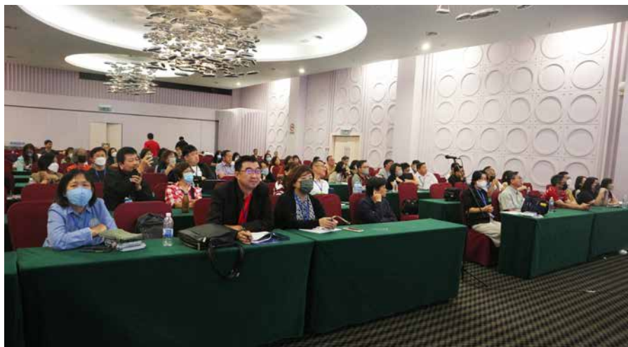
八十一人参加“幸福小组”工作坊。