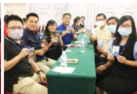
来自不同教会的弟兄姐妹彼此认识。