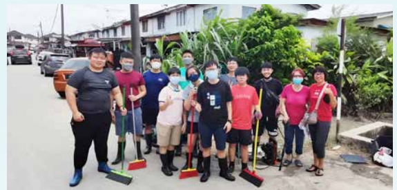
三月六日，新山和平教会、百合教会、真理堂与真道堂一起配搭，清洗灾区房屋。

截稿之际，仍然有许多长老教会组成赈灾队伍，陆续前往如三合港、永平、峇株吧辖等灾区，协助灾黎清洗家园，并获得灾黎们的积极回应，声声感谢。